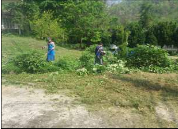
๑. จ้างเหมาดูแลตกแต่งและรักษาความสะอาดบริเวณสวนเฉลิมพระเกียรติ ๘๐ พรรษา